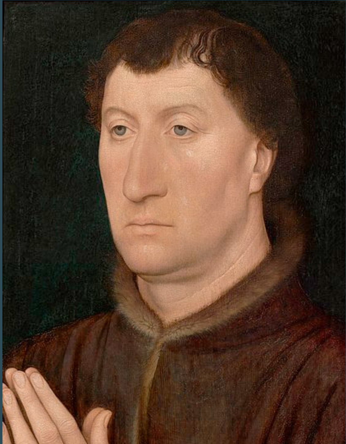
Hans Memling, Portrait of Gilles Joye, 1472